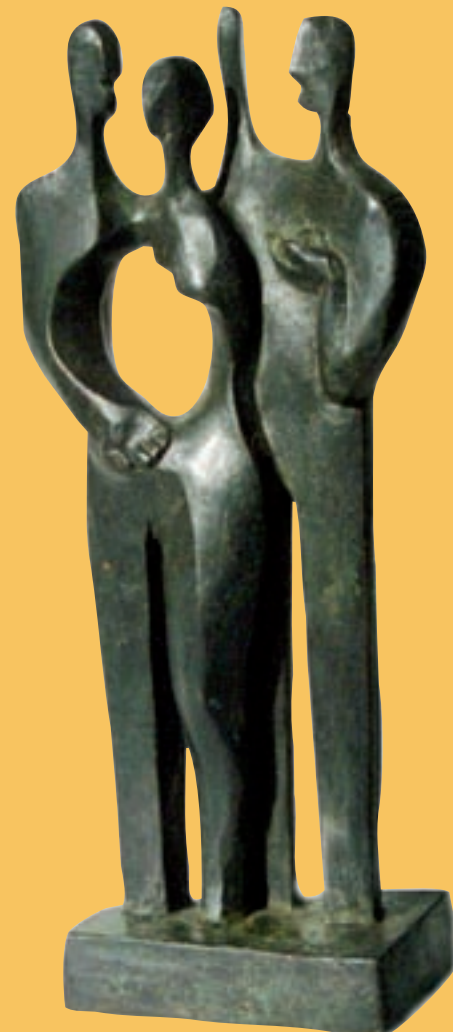
Escultura Premio Convivencia